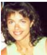
Auteure : Kathia Trottier