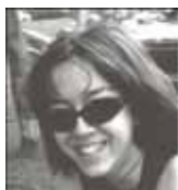
Illustratrice : Mélanie Rainville